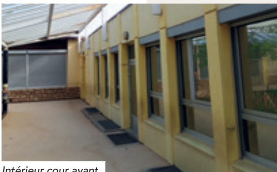
Intérieur cour avant