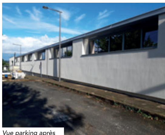
Vue parking après