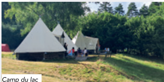
Camp du lac

Sans oublier le temps fort de l'été : le camp au lac des Settons, en Bourgogne, qui a laissé de beaux souvenirs aux jeunes participants.