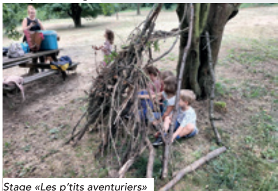
Stage «Les p'tits aventuriers»

Le centre de loisirs Acti'Jeunes a accueilli cet été 270 enfants, âgés de 3 à 15 ans, répartis sur trois semaines en juillet et une semaine en août. Chaque journée a été rythmée par des activités variées et des sorties très appréciées : piscine, Touroparc, Parc des Oiseaux... de quoi ravir petits et grands !