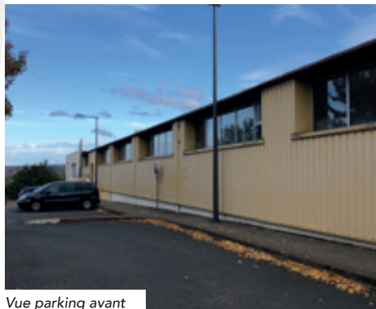
Vue parking avant

► Tennis : réfection du terrain intérieur et nettoyage complet du court extérieur