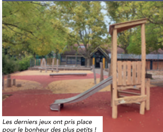
Les derniers jeux ont pris place pour le bonheur des plus petits !